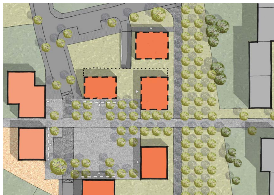
detail náměstí s vyznačením živých parterů