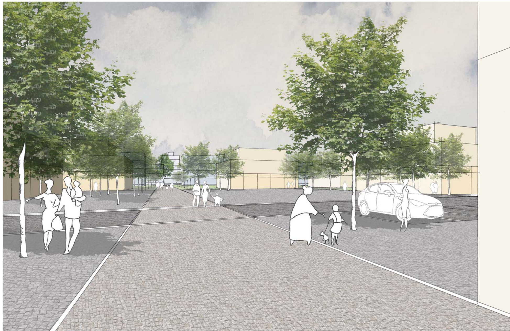
pohled od mateřské školy směrem k sídlišti