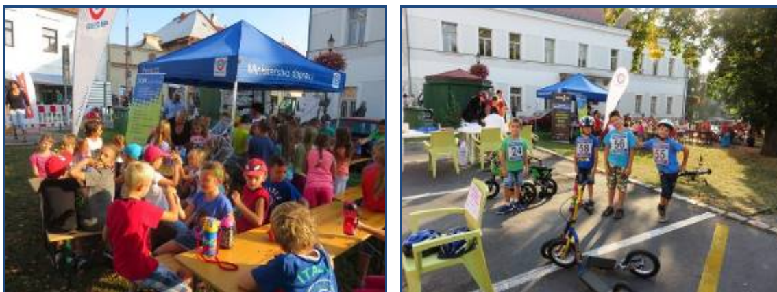
Ilustrační fotografie akce Dětský den bez aut

Jako příklady akcí a spolupráce veřejné správy, NNO a podnikatelů v rámci MA21 jsme uvedli akce Dětský den bez aut, Město v pohybu apod.