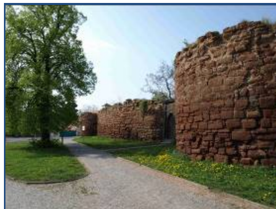
Ilustrační fotografie projektů Po městě na kole a Středověké hradby.