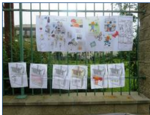
Ilustrační fotografie kampaně Den bez tabáku.