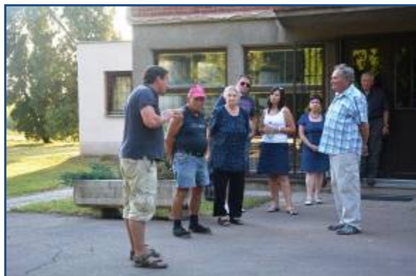
Ilustrační fotografie veřejného projednání odbahnění a revitalizace návesního rybníka ve Štolmíři a úpravy zeleně na místním hřbitově.