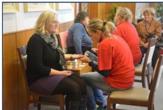
Ilustrační fotografie kampaně Týden mobility a Dny zdraví.