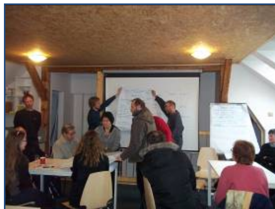
Ilustrační fotografie veřejného projednání využití kostela Sv. Havla ve Štolmíři.