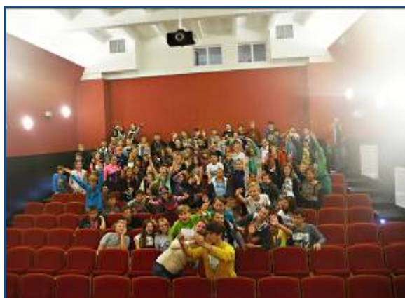
Ilustrační fotografie semináře Senior a bezpečná komunikace a akce Ozvěny festivalu - na obranu jídla